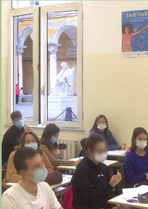
Studenti della Sede in classe.