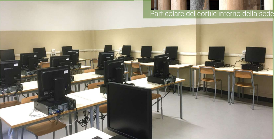
Il laboratorio di informatica della Succursale, che ospita il primo biennio del Colombo